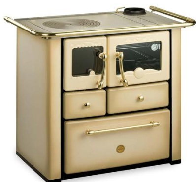
Cucina a legna sery