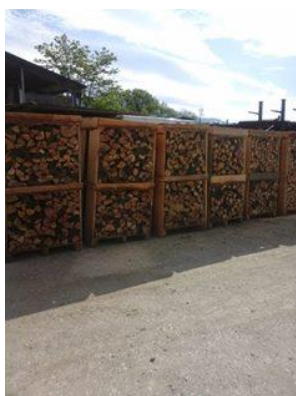
Bancali di legna