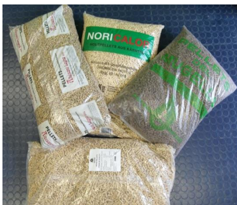
Pellet di vario tipo